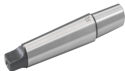
QUEUE DE MANDRIN CM2 - B18